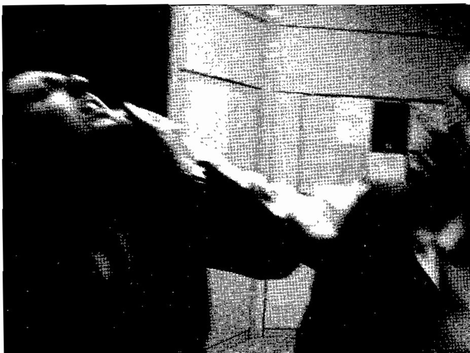
In aumento i casi di violenze sulle donne. Nel primo semestre del 2007, Napoli ha registrato un aumento di denunce del 20% rispetto all'anno scorso

Il docente di comunicazione, Ciambriello: magistrati troppo spesso influenzati da processi e dibattiti televisivi